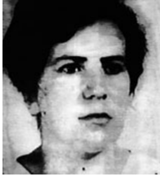
Desaparecida 10 - 08- 1976