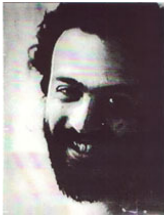
Desaparecido 2 - 12 - 1976